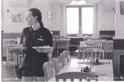
Zdroj: Sodexo Foto: Michal Ševčík, MAFRA

Průměrná útrata v roce 2020 144,5 Kč Průměrná útrata v roce 2021 169,2 Kč