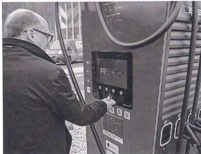
Z Velké Chuchle až do Sluzkova Super rychlá nabíjecí stanice dokáže za dobu průměrného nákupu dobít baterii automobilu na osmdesát procent. To odpovídá zhruba trase z Prahy do Jablunkova.

Zaroven řidiči takovýchto typů vozů mají v Praze výhody. „Město podporuje elektromobily třeba formou zvýhodněného parkování. Majitelé elektromobilů mají možnost parkovat v rámci zón zdarma,“ říká Chabr. Podle jeho slov však podpo-